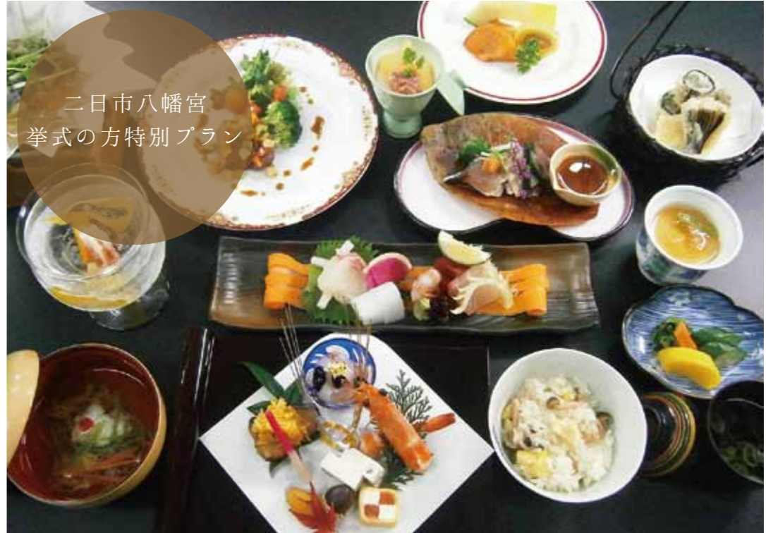
二日市八幡宮 挙式の方特別プラン